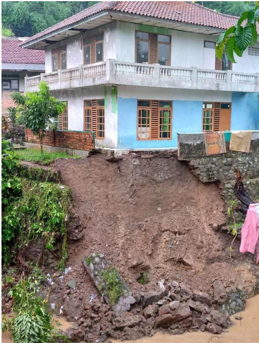
Gambar Lokasi Longsor (Kp. Cianting RT 001 RW 001, Belakang Masjid Al Falah)