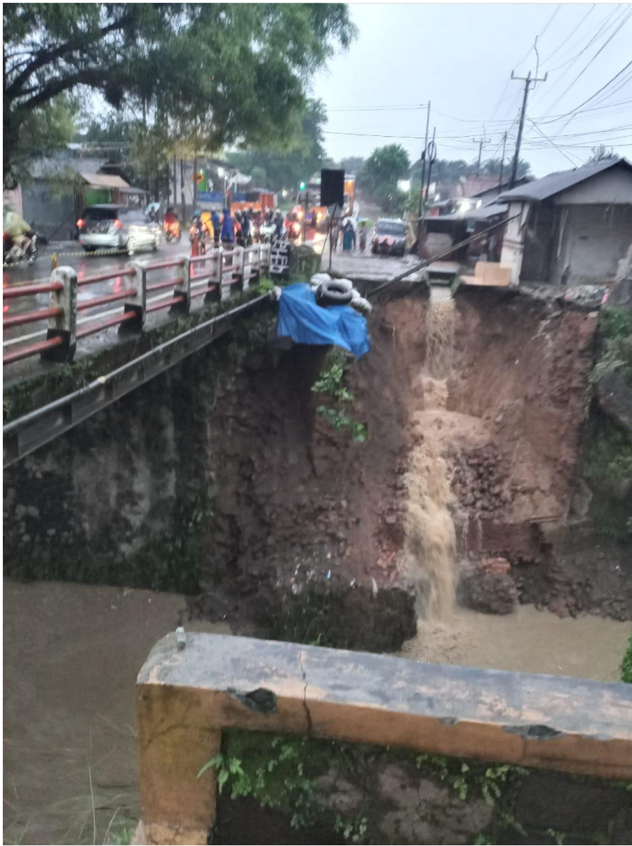
Gambar Longsor 2022 (Sekitar Lokasi Kejadian)